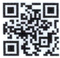
เอกสารประกอบ การรับฟังความคิดเห็น