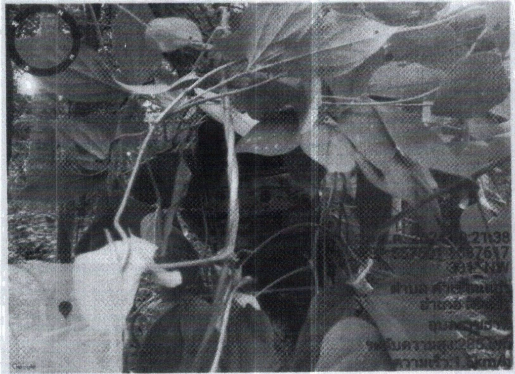
ภาพถ่ายกล้องขณะติดตาม เมื่อวันที่ ๒๐ กรกฎาคม ๒๕๖๗