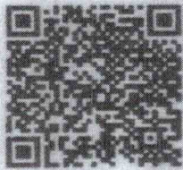
แผนปฏิบัติงาน ๒๕๖๖ ไปพลางก่อน จำนวน ๒๔ โครงการ/กิจกรรมงาน

๓) ๙๓๓๖๖.๑ - ๓๓๐๓๖๖.๑๐๑-๑๐๔ งบประมณ พ.ศ. ๒๕๖๖ ไปพลางก่อน (แบบ อส. ๑๐๑-๑๐๔) (ครั้งที่ ๑) วันที่ ๑๕ ก.ค.๖๖ / ๓๓๐๓๖๖.๑๐๑-๑๐๔ (๒๐๐๓) เพิ่มโครงการไว้ในอีกส่วน/ส่วน/ส่วนที่กรม/กรม/กรม ในส่วนที่ ก.ค.๖๖/๑๐๑-๑๐๔ ไปพลางก่อน/๑๐๑-๑๐๔