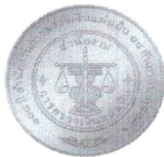
ชนิดเหรียญทองแดง ประเภทธรรมดา ขนาดเส้นผ่าศูนย์กลาง 30 มิลลิเมตร