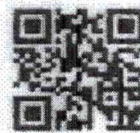
แบบตอบรับเข้าร่วมประชุม