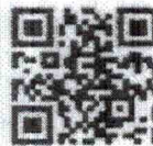
เอกสารประกอบการประชุม