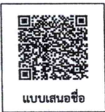
แบบเสนอชื่อ