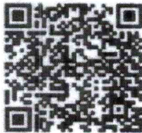
แบบประเมินผลฯ

อธิบดีกรมอุทยานแห่งชาติ สัตว์ป่า และพันธุ์พืช