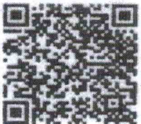
เอกสารแนบ

พนักงานธุรการชำนาญงาน รักษาการในตำแหน่ง ผู้อำนวยการส่วนอำนวยการ